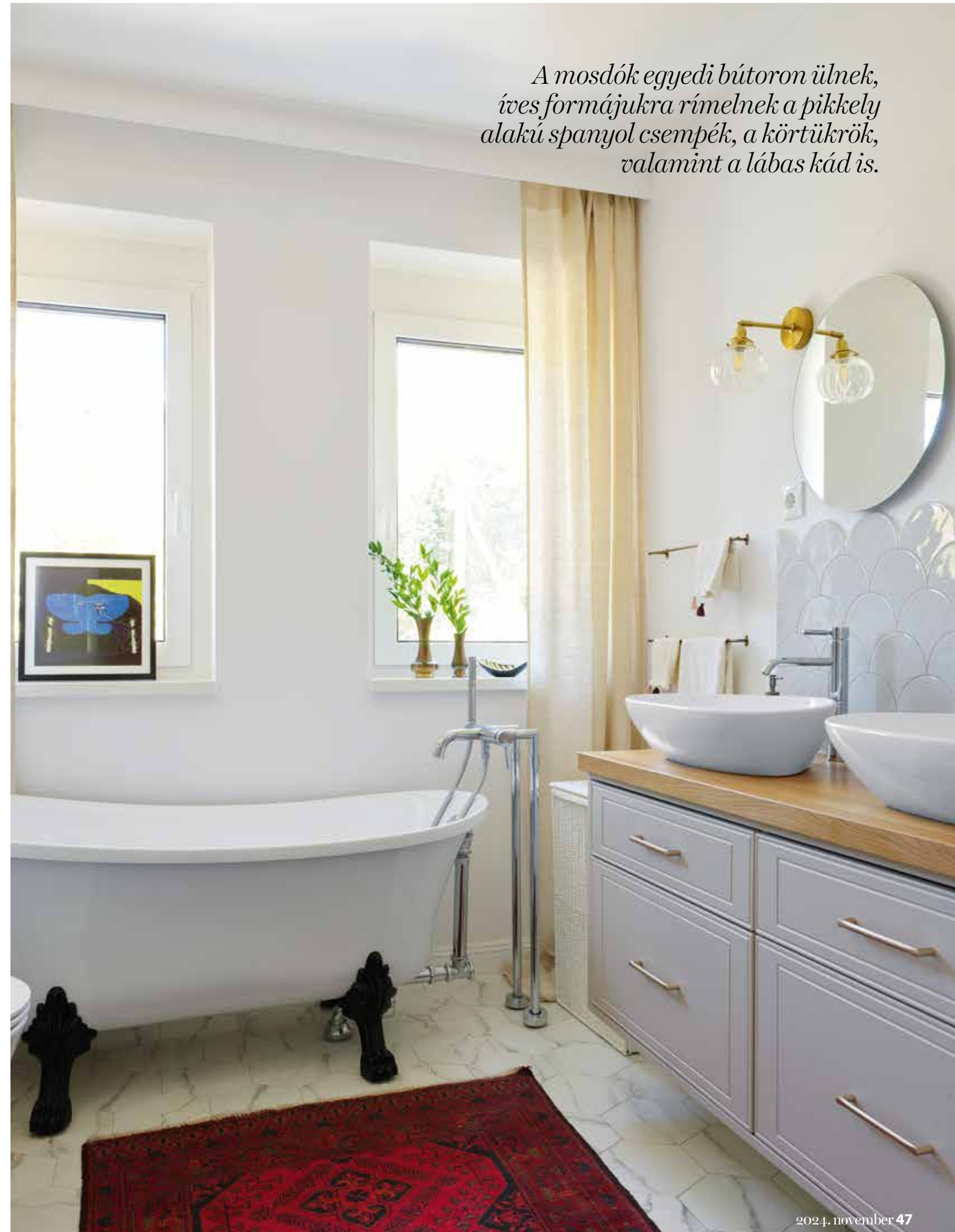
A mosdók egyedi bútoron ülnek, íves formájukra rímelnek a pikkely alakú spanyol csempék, a körtükrök, valamint a lábas kád is.