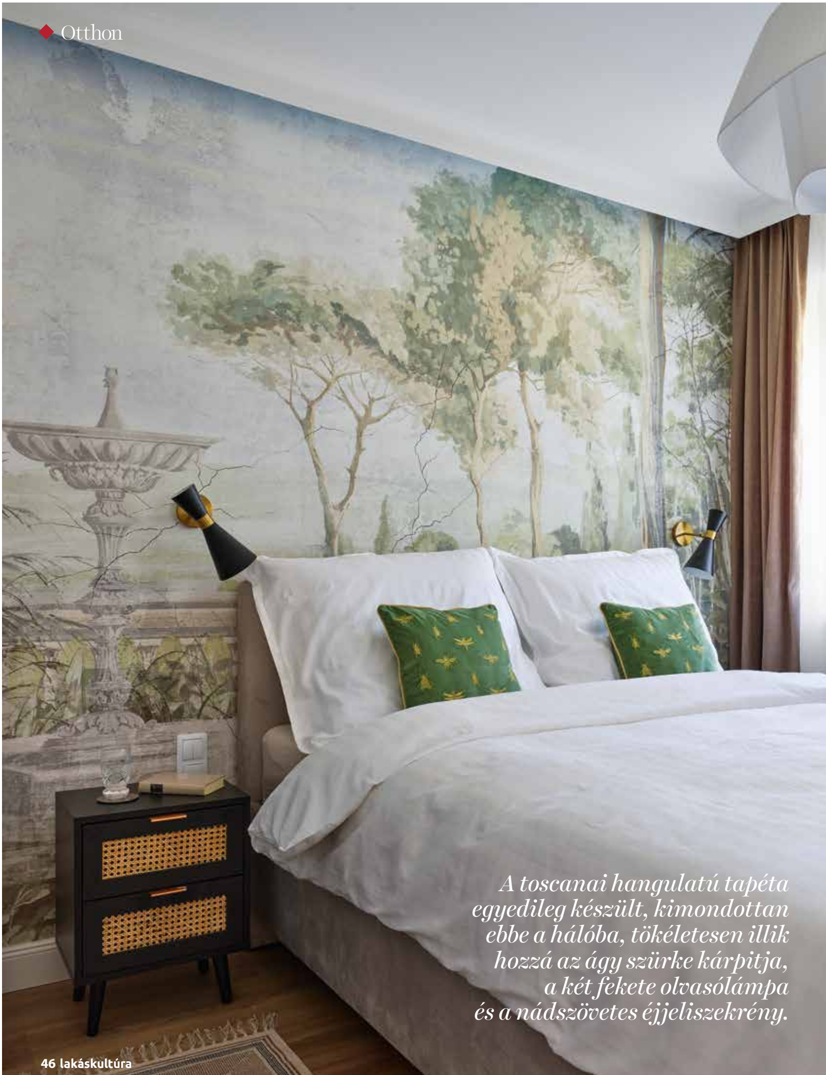
A toscanai hangulatú tapéta egyedileg készült, kimondottan ebbe a hálóba, tökéletesen illik hozzá az ágy szürke kárpitja, a két fekete olvasólámpa és a nádszövetes éjjeliszekrény.